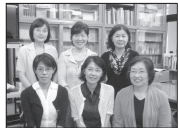
看護の統合と実践

看護の統合と実践の臨地実習においては、「統合実習Ⅰ・Ⅱ」を新設。「統合実習Ⅰ」では、複数患者を受け持ち多重課題時の看護師の役割について体験から学ぶこととし、「統合実習Ⅱ」では、3年間の最終実習として位置づけ、看護管理や夜間帯の実習等を通して看護業務の複雑・多様化の理解、国民の期待や患者の視点に立った質の高い看護の提供の必要性などの理解を促し、臨床実践の中で必要な基礎的知識と技術を統合して学び、卒業時の看護技術の総合評価を行うように計画した。更に、看護の統合と実践の科目として、従来基礎看護学に位置づけていた「看護研究」を含め、自己の看護観をまとめることとした。