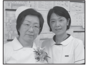
在宅看護論 峰村 吉田

在宅看護論は、地域で生活しながら療養する人々とその家族を理解し、在宅での基礎的な看護技術を身につけ、他職種と協働する中での看護師の役割を理解する内容とした。