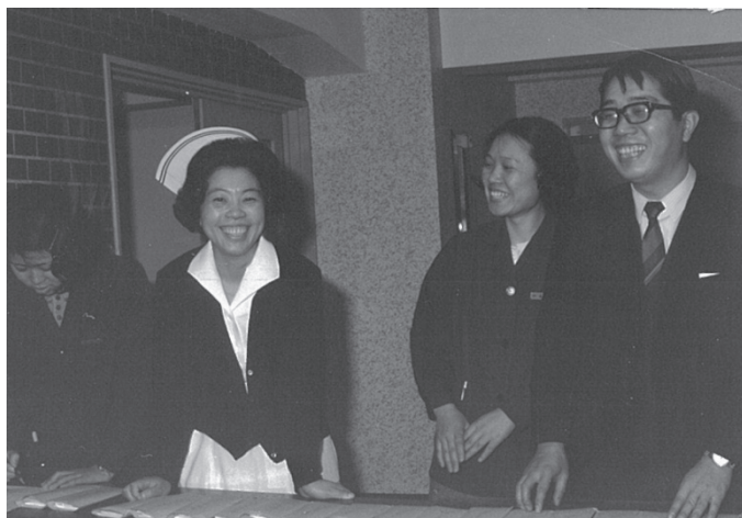
別科 2 回生入試合格発表の日(昭和 46 年 4 月 22 日)

思い出はつきませんが、卒業生の活躍する姿を思い浮かべ、当時の先生方への感謝の気持ちを込めながら、皆様のご健勝をお祈りしつつ筆をおきます。